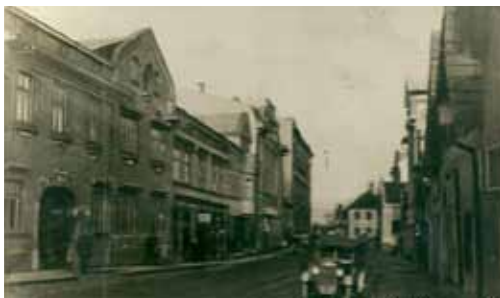
pohlednice z roku 1934