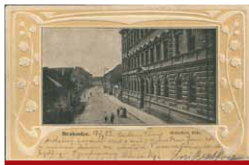
Pohlednice z roku 1903