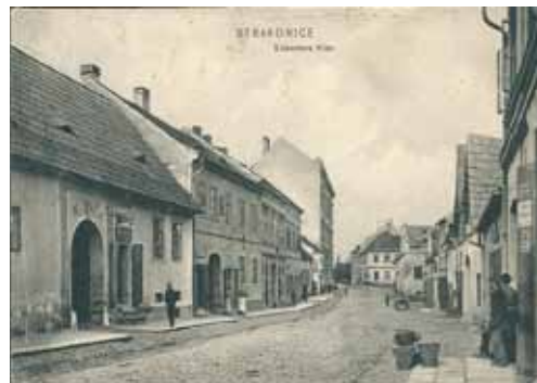
pohlednice z roku 1907