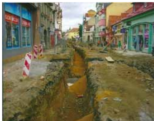
Foto z r. 2012, nová inženýrská síť