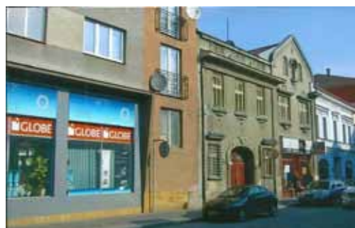
Foto z roku 2014