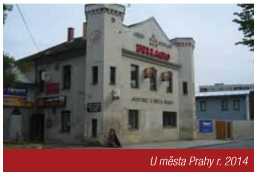
U města Prahy r. 2014