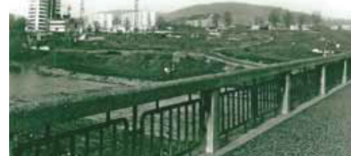
Výstavba sídliště 1. Máje