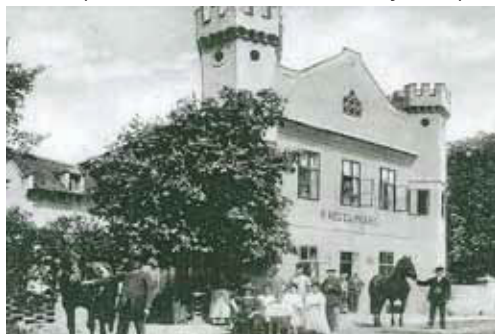
Hostinec U města Prahy, období R-U