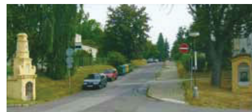
Kapličky v Hradeckého nyní