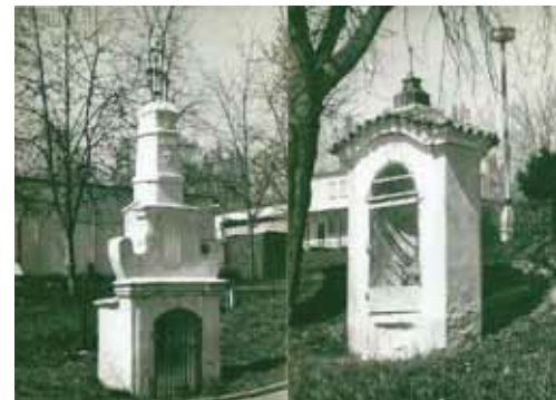
Kapličky v Hradeckého dřív

války setkala vojska americké a ruské armády. V devadesátých se tu říkávalo „U Džima“. Vedle bývala