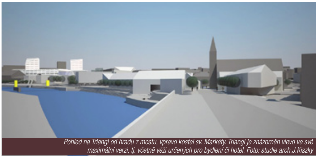
Pohled na Triangl od hradu z mostu, vpravo kostel sv. Markéty. Triangl je znázorněn vlevo ve své maximální verzi, tj. včetně věží určených pro bydlení či hotel. Foto: studie arch. J. Kizsky

ně je podstatné. Kizka opět navrhuje více variant a budovu doslova seskládal jako stavebnici, v níž lze pokračovat s dobudováním a přístavbami objektů. Pokud by investoři měli zájem, Triangl ve své maximální verzi zahrnuje i věže jako varianty pro bydlení či hotel. Kromě toho se ve studii objevuje i Pivovarské náměstí s lavičkami a zelení, rozprostírající se před vchodem do pivovaru. Jedna část navrženého Trianglu se nachází už na pozemku stávající rychlostní silnice Katovická. „Realizace proto logicky závisí na výstavbě severního dopravního půloblouku, po níž bude možné Katovickou zúžit a proměnit na boulevard. Další podmínkou pro uskutečnění těchto vizí je dostatečný zájem a finanční síla investorů,“ podrhnul nad studií Kizsky Andrлік.