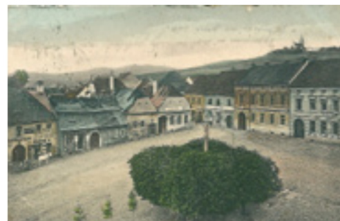
náměstí s pohledem na Malsičku r. 1902