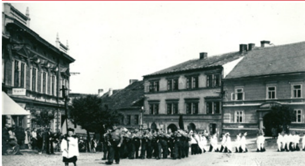
Foto z pohřbu řezníka, smuteční průvod náměstím na Malsičku