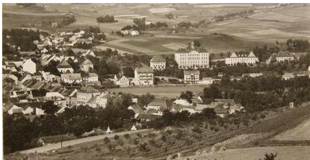
Pohled na základní školu a bývalou mateřskou školu r. 1953

Na hřbitově na Malšičce najdeme náhrobky rodáků a významných osob: spisovatele