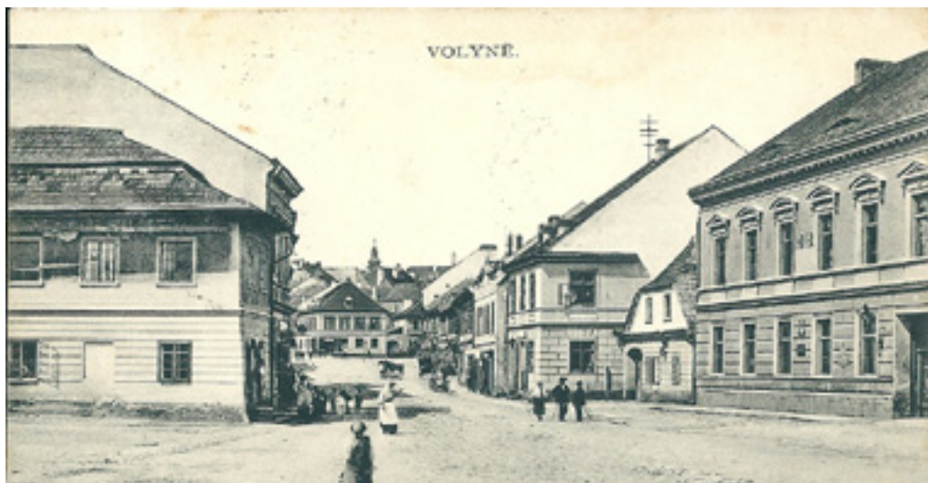
sílnice k hornímu náměstí r. 1909

Hledáme střípky z historie Strakonice a okolí. Čtenářské snímky a příběhy otiskneme a oceníme!