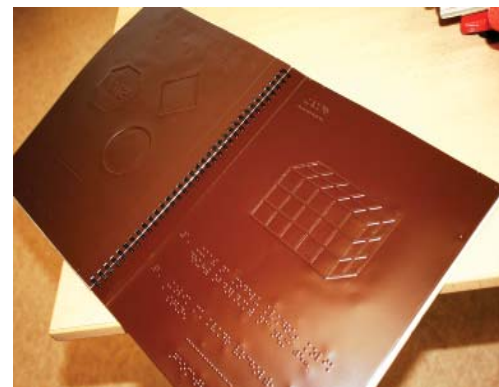
Foto nahoře: učebnice pro nevidomé ve 3D a s Braillovým písmem. Foto dole: učební pomůcky, které vyrábí Karlíkova asistentka Eva Marková. Tyto výrobky později slouží k učení dalším nevidomým dětem, se kterými jsou Leskovcovi v kontaktu a pomůcky jim předávají.