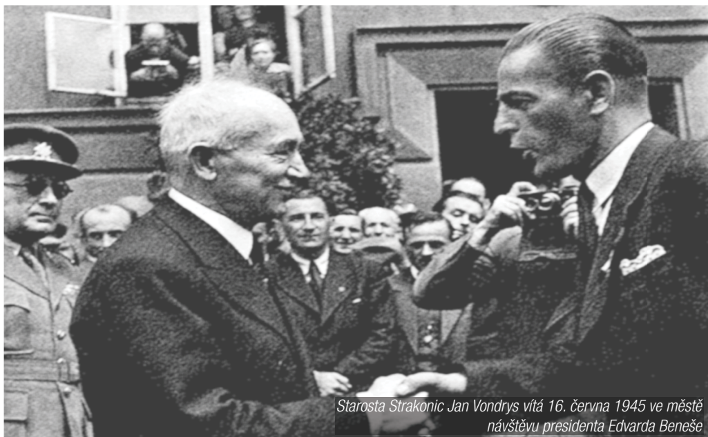
Starosta Strakonice Jan Vondrys vítá 16. června 1945 ve městě návštěvu prezidenta Edvarda Beneše