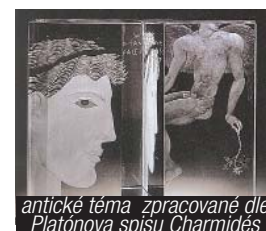
antické téma zpracované dle Platónova spisu Charmidés