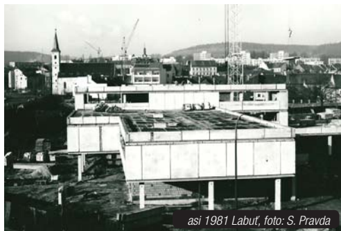
asi 1981 Labuť