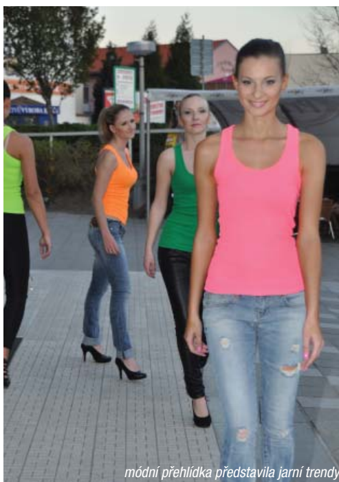
módní přehlídka představila jarní trendy