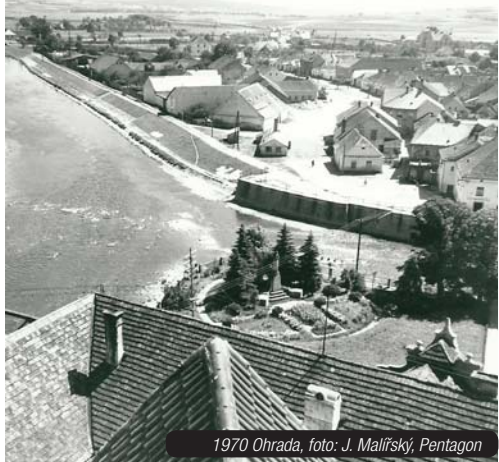
1970 Ohrada, foto: J. Malířský, Pentagon

„Jelikož sbírám věci kolem historie Strakonice a okolí 39 let, nahromadil jsem tolik věcí, že je těžké určit, kdo z nás je přesně dělal. Snímky od