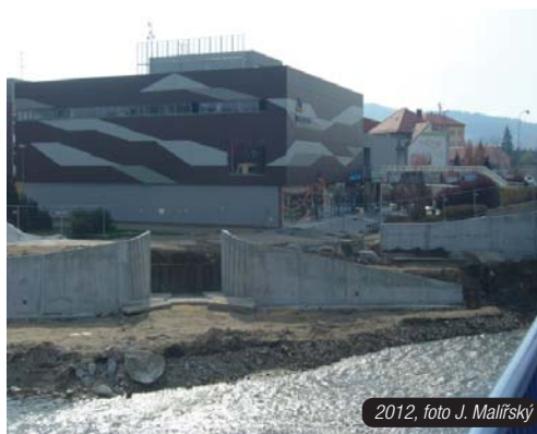
2012, foto J. Malířský

nebo lidé z jeho okolí: „Víte, byla to rozporuplná doba. Zrovna se bouralo původní přemostění u hradu a Strakonice ztrácely svou historickou podobu. Lidé byli rozčarovaní. Když pak vzniklo