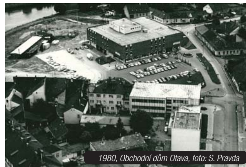
1980, Obchodní dům Otava, foto: S. Pravda

volné prostranství, asi se přemýšlelo o tom, jak ho využít a předpokládám, že tak nějak vznikl nápad postavit obchodní dům Labuť. Dnešní podoba toho objektu mi připadá, jakoby esteticky lépe zapadala do té moderní části směrem od mostu, která se tam rozvíjí,“ vyprávěl muž, který