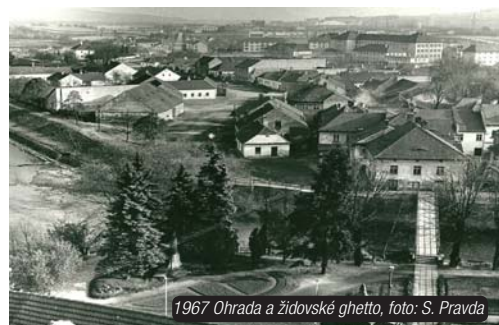
1967 Ohrada a židovské ghetto

volné prostranství, asi se přemýšlelo o tom, jak ho využít a předpokládám, že tak nějak vznikl nápad postavit obchodní dům Labuť. Dnešní podoba toho objektu mi připadá, jakoby esteticky lépe zapadala do té moderní části směrem od mostu, která se tam rozvíjí,“ vyprávěl muž, který