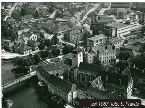
asi 1967

Čtenářům, kteří nás kontaktují se zajímavými náměty, děkujeme. Našel se mezi nimi jeden takový, jenž vedení redakce přivedl k myšlence poskládat mozaiku ze čtenářských střípků o historii budovy obchodního domu Labuť, nynějšího OC Maxim.