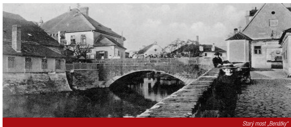
Starý most „Benátky“

V této době je jednoznačnou dominantou města hrad s kostelem sv. Prokopa. Dalšími orientačními body je špitální kaple na levém břehu Otavy, přestavěná počátkem 15. století na kostel sv. Markéty, a kostel sv. Václava z počátku 14. století v obci Lom. Tyto stavby se také dochovaly dodnes, ostatní dřevěné domy nevydržely nápor požárů a povodní. Výjimkou jsou, sice mnohokrát přestavované, ale v jádru původní, tři domy a masné krámy na dnešním Velkém náměstí. Od západu k východu jsou to domy Papežovy s č. p. 44 a 45, dům U Hroznu č. p. 54 a již zmíněné masné krámy. Podle jejich umístění si můžeme představit tehdejší uliční čáru.