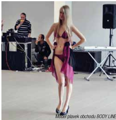
Model plavek obchodu BODY LINE

Kromě dovedností, jako malování, zpívání, hod míčkem, se dětem ještě viditelně zalíbilo v dětském koutku Toledo Ivany Váchové, který se nachází přímo v budově OC Maxim. „Nejlepší byl jezdicí