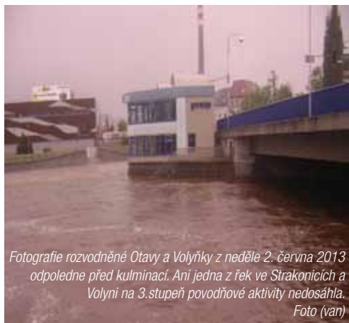
Fotografie rozvodněné Otavy a Volyňky z neděle 2. června 2013 odpoledne před kulminací. Ani jedna z řek ve Strakonících a Volyni na 3. stupeň povodňové aktivity nedosáhla.

Využijte možnosti sledovat Strakonickou televizi, která pro své diváky zaznamenala Divadelní Piknik Volyně 2013, což je celostátní přehlídka amatérského činoherního a hudebního divadla. Konala se o dvou prodloužených květnových víkendech ve Volyni. Ohlédnout se prostřednictvím STTV můžete i za velkou vodou ve Strakonících a záznam Otavy z neděle 2. června 2013. Na začátku června se také uskutečnil Národní šampionát mažoretkových skupin, kde kamery Strakonické televize opět nechyběly.