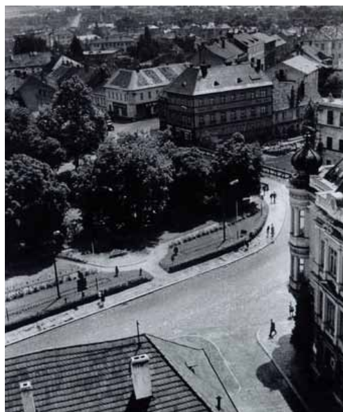
zajímavý pohled na palác a okolí dnešního OC Maxim

Zmizely staré mosty a z regulačního plánu, podle kterého se mělo město vyvíjet, se uskutečnilo jen velmi málo. Průmyslový rozvoj pohltil staré Strakonice „ve jménu pokroku“. Žabokrty, malý shluk nízkých domů na levém břehu Volyňky, sousedily přímo s vodním hradem a nejčastěji zde žili služebníci hradních pánů. Bezděkov, vesnice spíše zemědělského charakteru, se rozkládal na pravém břehu Volyňky a její osou byla cesta k osadě Lom, která vzniká v průběhu 13. století na úpatí vrchu Srpská. Severní okraj Bezděkova Ohrada, na břehu Otavy, byl dříve také samostatným ostrovem. Poslední a zároveň nejdůležitější osadou bylo uskupení domů na levém břehu Otavy, kde sídlili Strakoničtí. Toto budoucí centrum města Strakonice je rozděleno na dvě části slepým ramenem Otavy a již ve 14. století se zde utváří půdorysy dvou podlouhlých náměstí, které zůstaly téměř nezměněny dodnes. Také přemostění mezi Velkým a Menším městem pochází již z počátku 14. století stejně jako kamenný most spojující hrad s Menším městem.