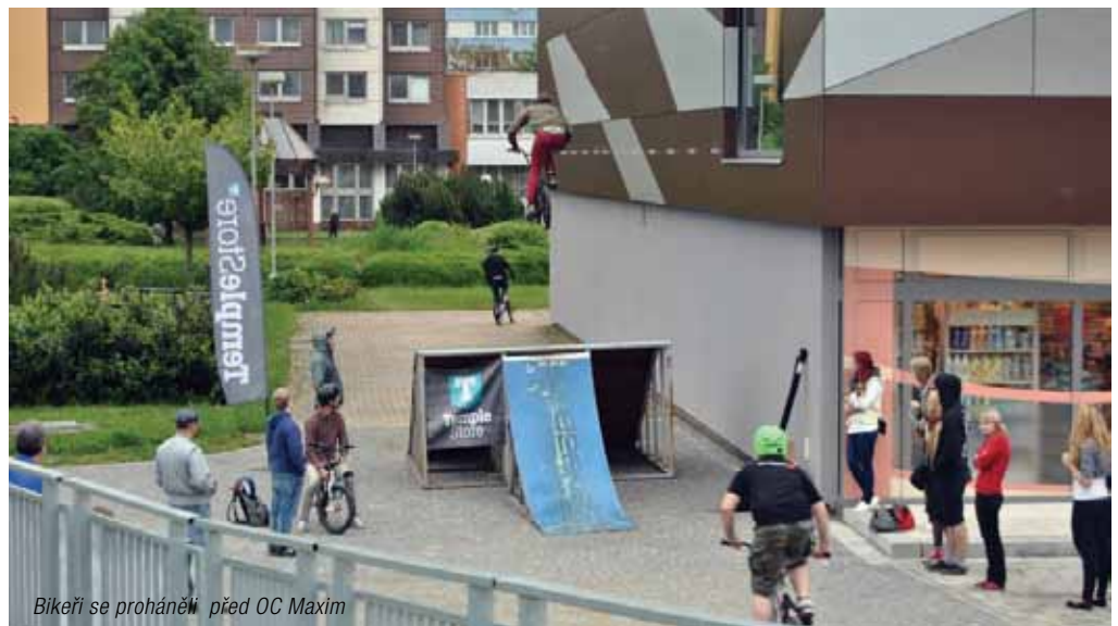
Bikeři se prohánějí před OC Maxim

plyšový kůň, trampolína a nafouknutá klouzačka,“ řekl čtyřletý Martínek, který se v moderní herně zabavil přes dvě hodiny. Toledo mělo výrazně zlevněné vstupné a kromě herny panoval čilý provoz i v minikuchyňce, která nabízí občerstvení k jídlu i pití