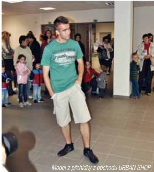
Model z přehlídky z obchodu URBAN SHOP