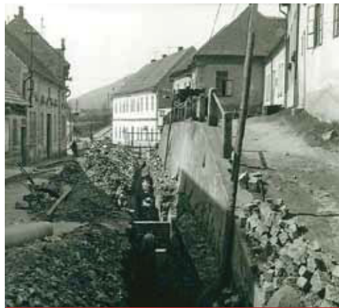
Pokládání kanalizace v Bavorovo ulici.