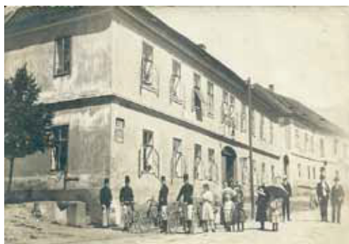
Bývalá čtenářská kasárna, pohled z r. 1908