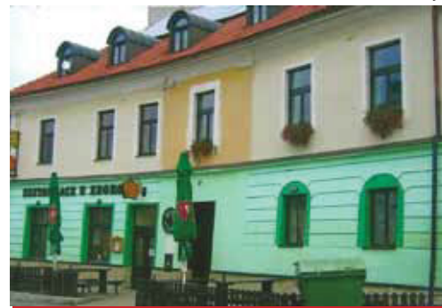
Restaurace u Zborova v současnosti.