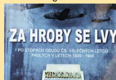
foto obalu knihy

O unikátních výpravách členů klubu historie letectví Jindřichova Hradce se dočtete na straně 10 - 11. Úspěšný projekt brzy přesáhl hranice jihočeského regionu.