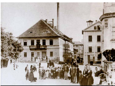
Továrna D na Dubovci, kde se vyráběly viněné látky do celého světa