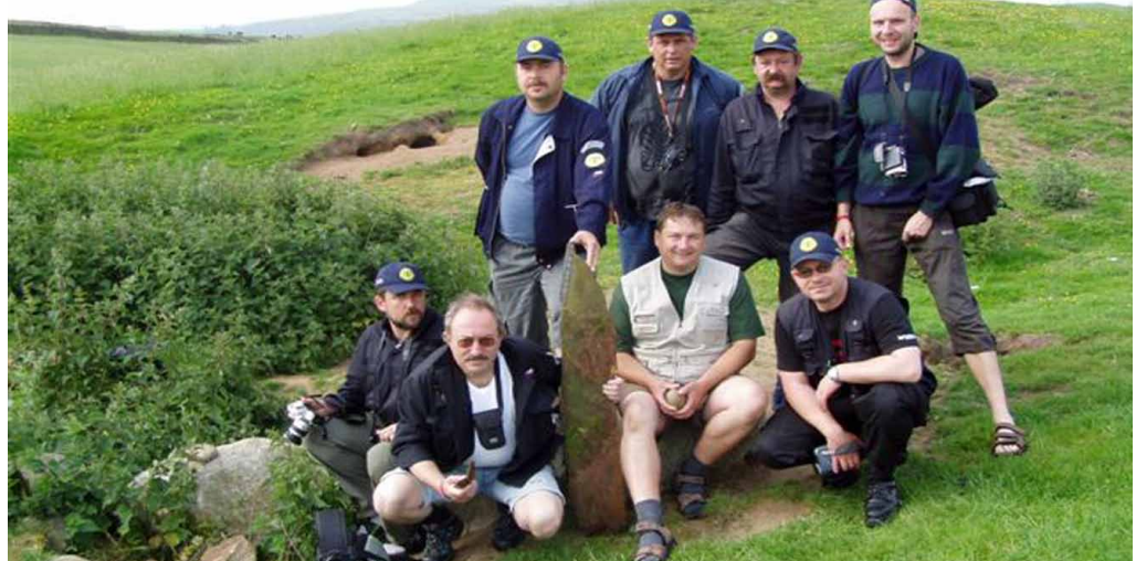
Členové KHL objevili ve Skotsku místo dopadu stíhačky Spitfire. V kráteru zůstala i původní vrtule.