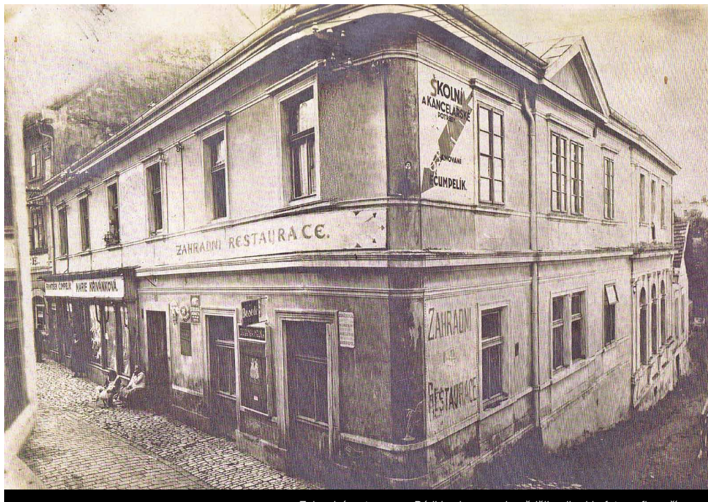
Zahradní restaurace. Rádi bychom se dozvěděli, odkud je fotografie pořízena.

Jak se tak zdá, mají Strakonice velkou spoustu zarytých příznivců, protože nouzi o historické fotografie opravdu nemáme. Každý měsíc se nám čtenáři ozývají a my jim tímto děkujeme.