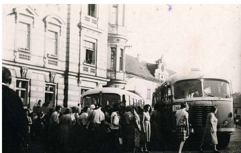
Palác, Bezděkovská ulice- Shromáždění před odjezdem na pionýrský tábor „fezárských“ dětí