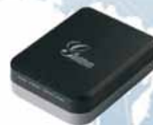
VoIP brána pro připojení klasických tel. přístrojů ( cena: 990,- Kč )

Možnost pronájmu VoIP zařízení 50,- / měs