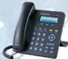
Plně digitální VoIP telefon ( 1090,- Kč )