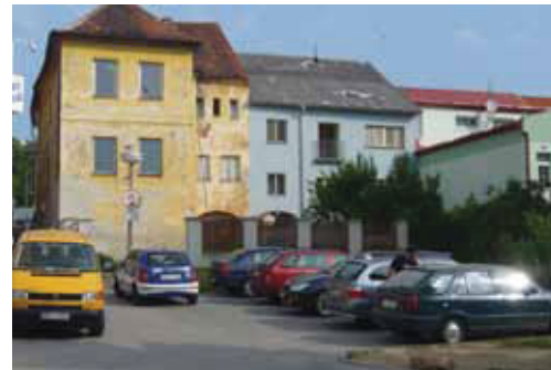
Hrnčířská ulice. v současnosti