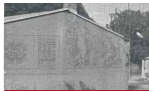
Dům č. p. 624 ještě se sgrafity v Sokolovské ulici.