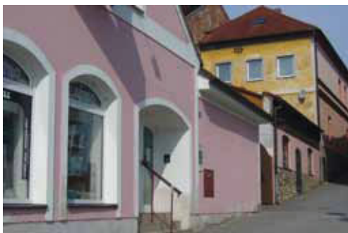
Hrnčířská ulice. v současnosti