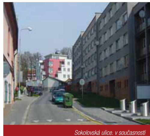
Sokolovská ulice. v současnosti