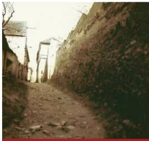
Stará Hrnčířská ulice.