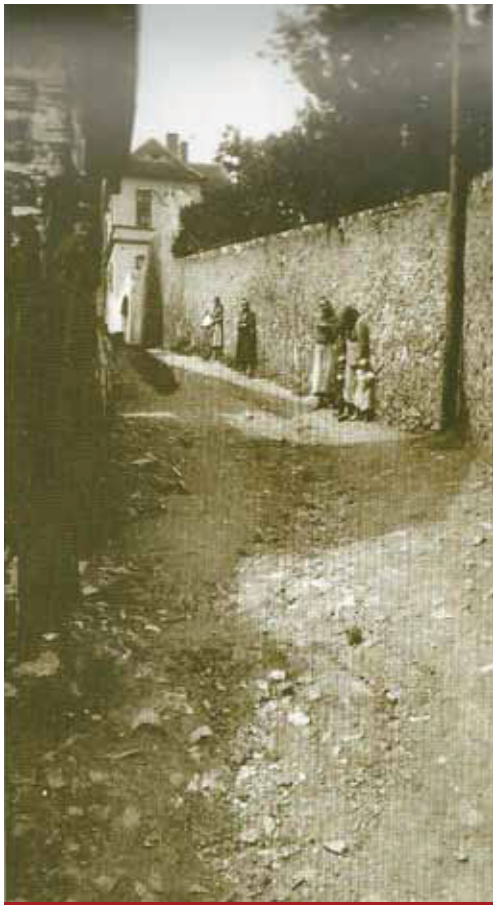
Stará Hrnčířská ulice.