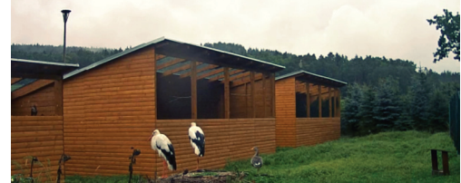
webová kamera ukazuje krásné nové voliéry a čapí rodinku

malých hrdliček a zraněné jirňky. Čapí rodinku, o které jsme vám psali v dubnu obohatila o svou přítomnost čtyři čápata. Jedno z nich ale museli odchovat chovatelé a později ho do hnízda vrátili. Rodiče čápě přijali zpět bez problému.