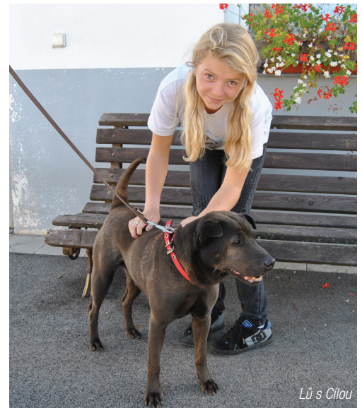
Lů s Cílou

Až najde nový domov, určitě nebude mít problém zvyknout si v novém prostředí. Ten, kdo by ho chtěl, by měl mít už s pejskem zkušenost, aby věděl, jaká starost a radost ho čeká. Tomuhle pejskovi se musí plně věnovat, určitě by ho neměl mít člověk, který je deset hodin v práci, a pes se nevyvenčí. Potřebuje pohyb! Nejlepší páníček