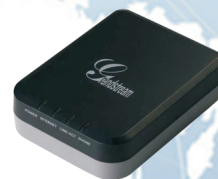
VoIP brána pro připojení klasických tel. přístrojů ( cena: 990,- Kč )

Možnost pronájmu VoIP zařízení 50,- / měs