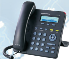
Plně digitální VoIP telefon ( 1090,- Kč )