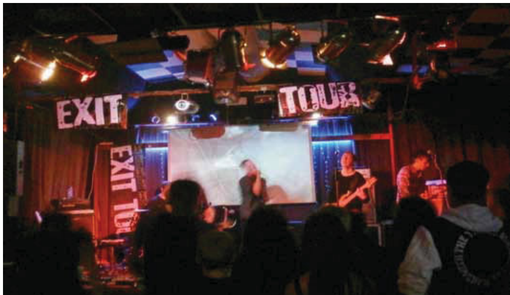
pokračování na str. 2

EXIT Tour by se však nekonala ani bez pomoci místní neziskové organizace Křesťanské akademie mladých a rockové kapely Dizmas z Kalifornie. Díky výše jmenovaným se uskutečnily kulturně-vzdělávací programy pro teenagery. Obsah tak naplňoval požadavky ministerstva školství na zajištění Minimálního