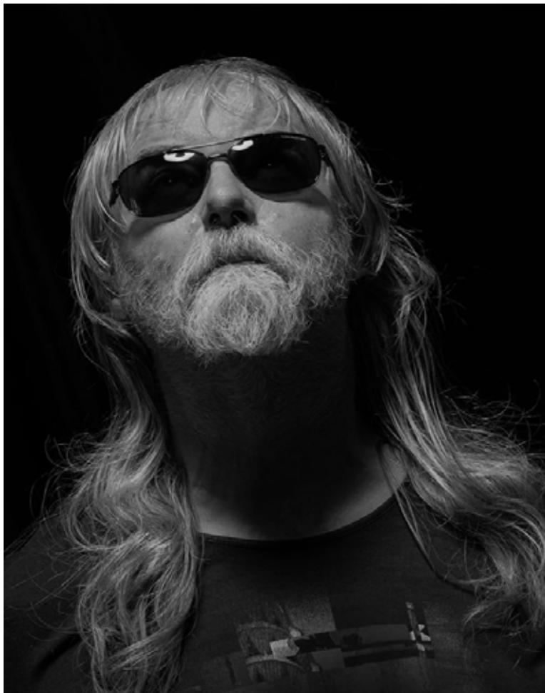
pokračování z titulní strany