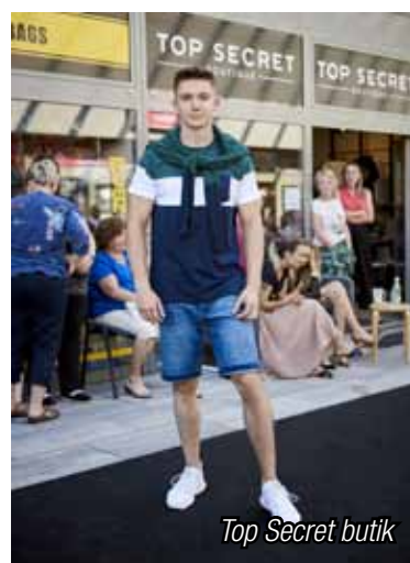
Top Secret butik