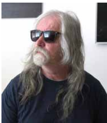
Jan Vávra (* 16. února 1953 Praha) je český umělecký fotograf se zamě-

řením na inscenovanou konceptuální fotografii, představitel tzv. neopiktoralismu. Vystudoval Institut výtvarné fotografie v Opavě. Od roku 2001 působí jako pedagog na Vyšší odborné filmové škole v Písku a vede fotografický seminář, později též i na Filmové akademii Miroslava Ondříčka. Od roku 2005 je externím pedagogem na Vyšší odborné umělecko-průmyslové škole tamtéž.