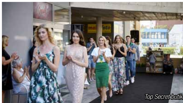
Top Secret butik